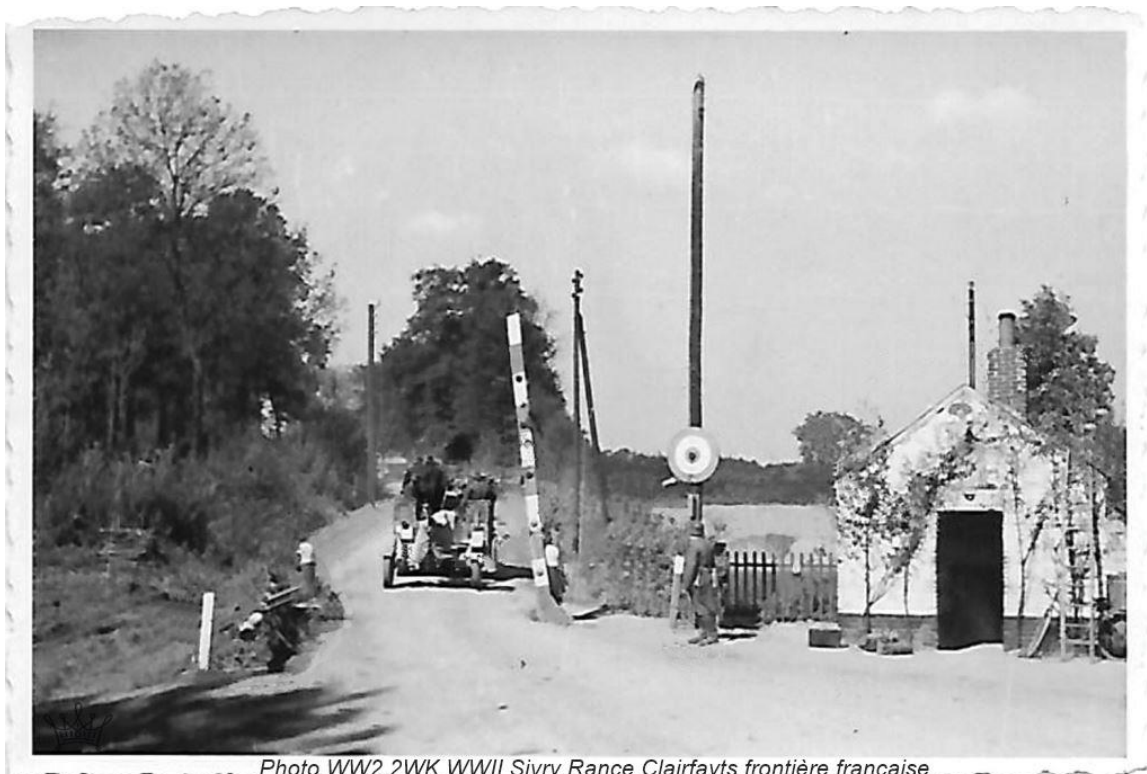
Photo WW2 2WK WWII Sivry Rance Clairfayts frontière française

Entrée Canon allemand sur le territoire de Clairfayts