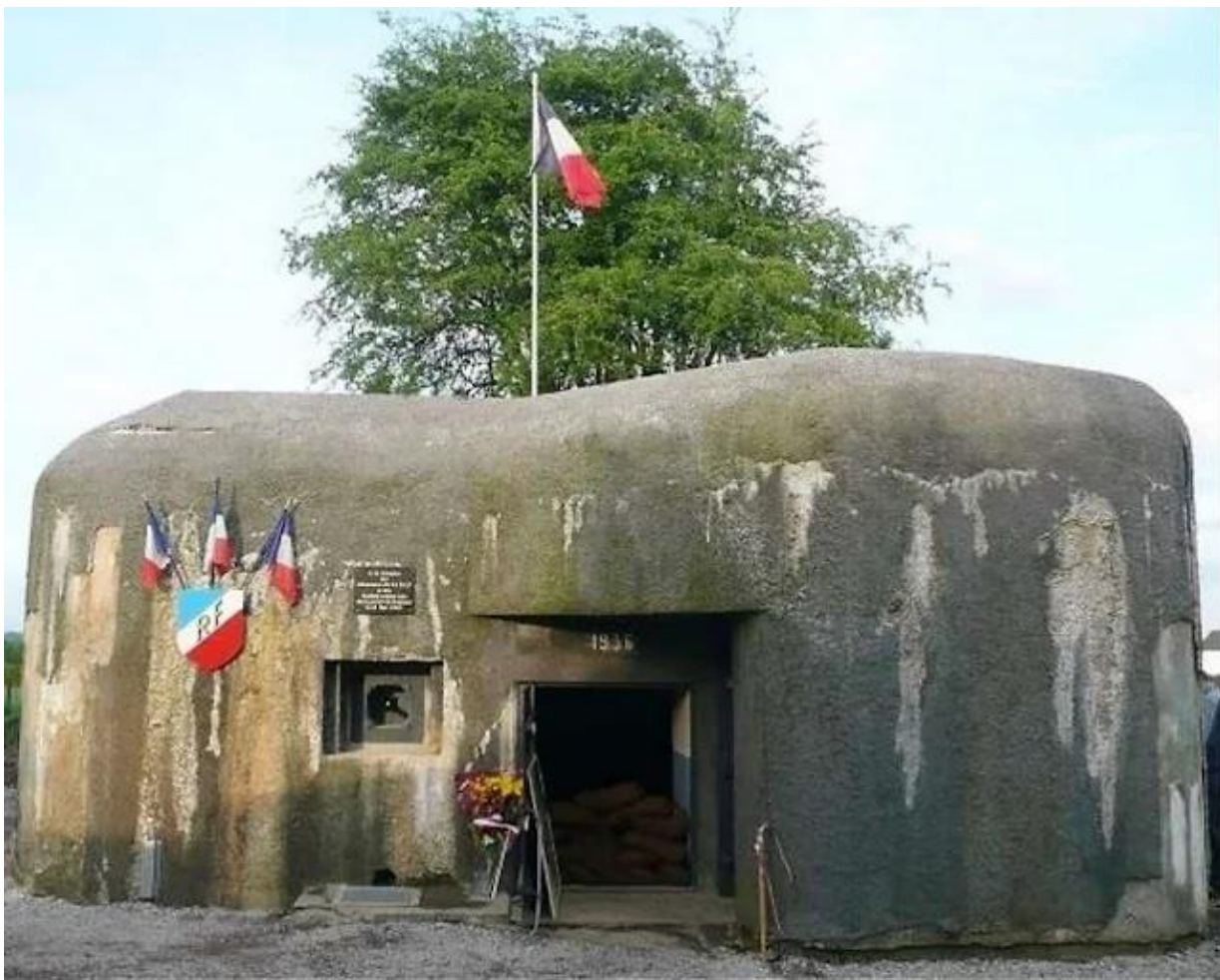
le bloc B721 – TRIEUX du CHENEAU

Le bloc était armé en 1940 d'un canon antichar de 25mm, d'une mitrailleuse Hotchkiss et d'un FM