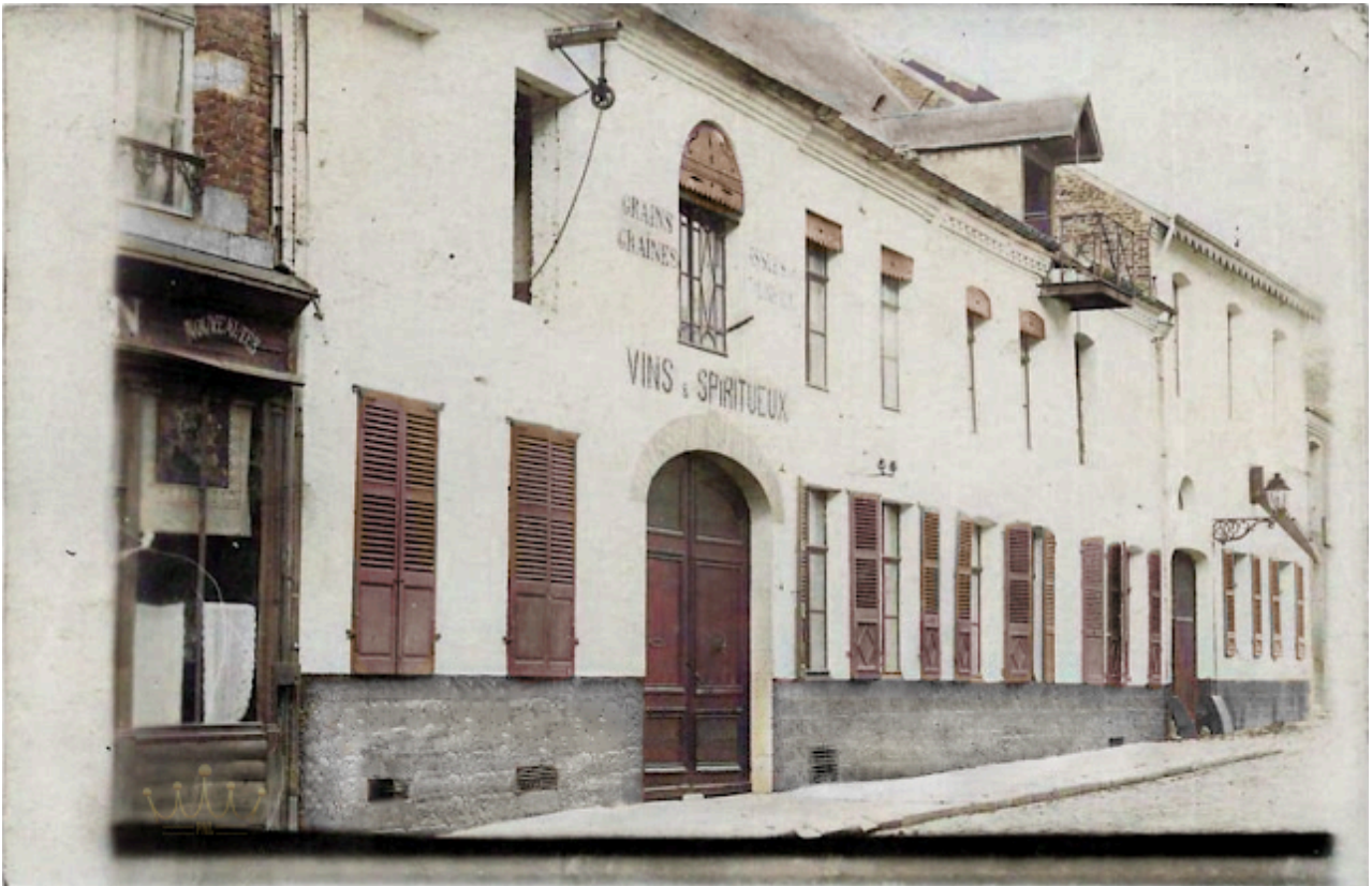
La brasserie ROUEZ-CUISSET vers 1910

Outre la production de 6000 hectolitres de bière de fermentation haute, elle se diversifie dans la commercialisation de vins et spiritueux, ainsi que grains et tourteaux.