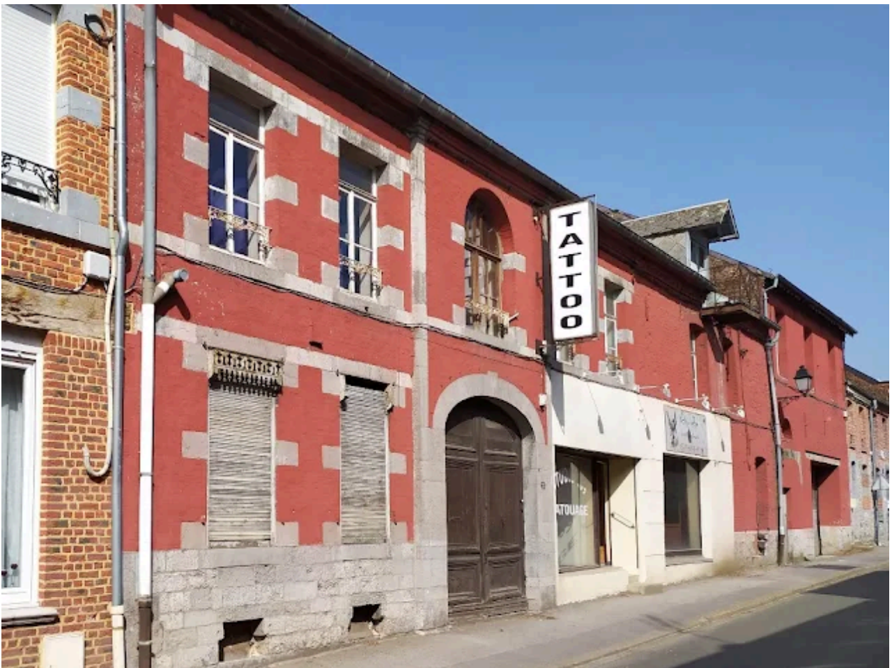
Ancienne brasserie au 30, rue de Beaumont

"Bières toujours garanties d'une fabrication très sincère ne contenant que de l'orge et du houblon de 1er choix" Telle était la devise de la Brasserie-Malterie ROUEZ-CUISSET & Cie (30, rue de Beaumont)