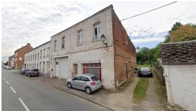
Bâtiment subsistant de nos jours

Finalement, l'établissement cesse ses activités en 1954.