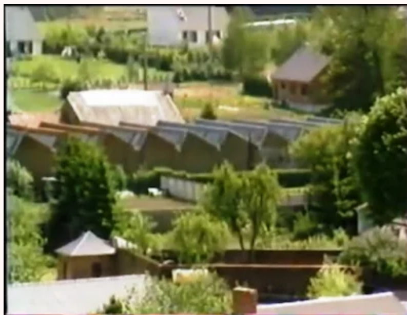
Extrait du film "En cent ans la Solre nous faisait l'industrie"

👉 VIDEO ATELIERS H. COLLET (Période D. SAUNÉ) https://youtu.be/gjb_A862NNE