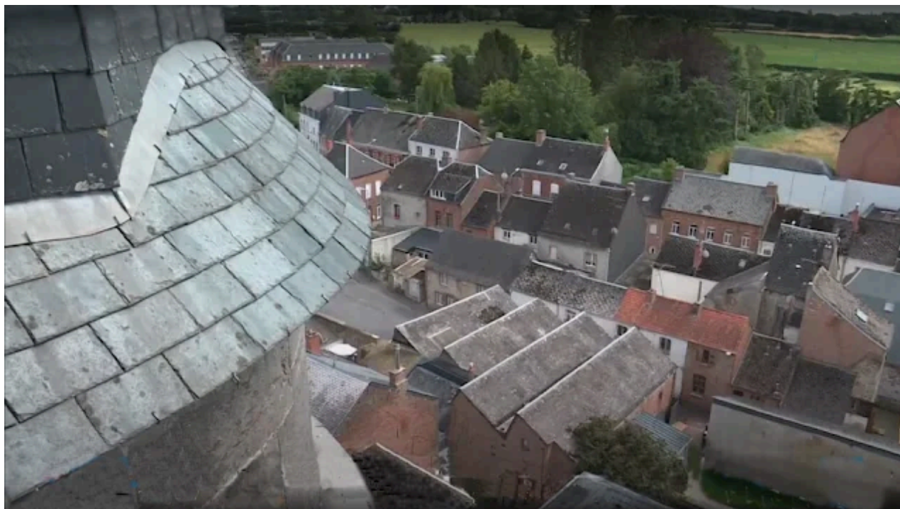
Bâtiments subsistants du Tissage Rouez - Stand de tir