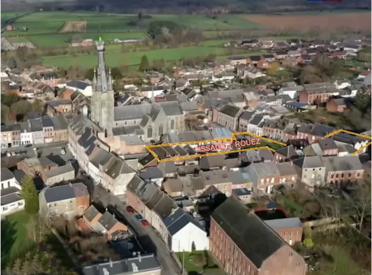
Bâtiments subsistants du Tissage Rouez

En 1841, l'atelier de Jules Rouez ouvre ses portes sur la Place Verte. Au fil des années, il se modernise, équipant ses installations d'une chaudière à vapeur vers 1855 pour accroître sa capacité de production. L'atelier emploie environ une centaine d'ouvriers spécialisés dans la filature et l'apprêt. Cependant, face à une pénurie de main-d'œuvre locale, Jules Rouez se tourne vers les travailleurs frontaliers belges pour renforcer ses effectifs.