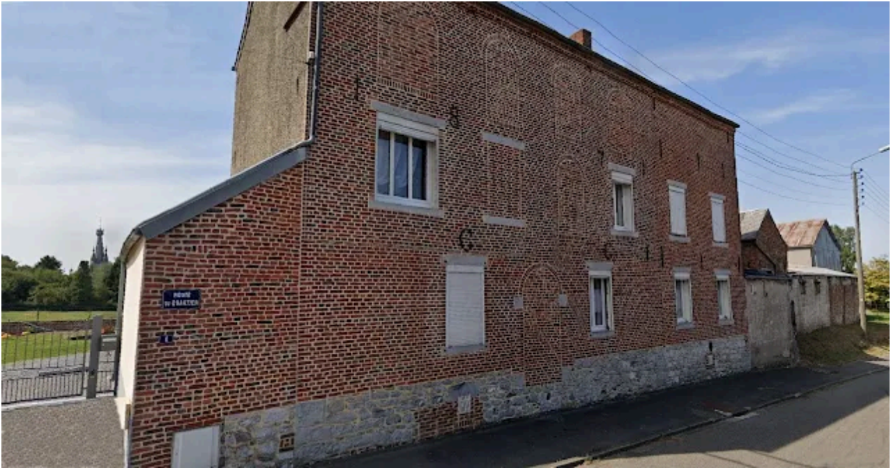
Ancienne tannerie Guislin - Grard